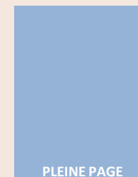
L 210 x H 280 mm PP